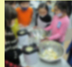
おやつ作り。ポーンポーンと飛び出てるポップコーンに、みんなで大はしゃぎ!